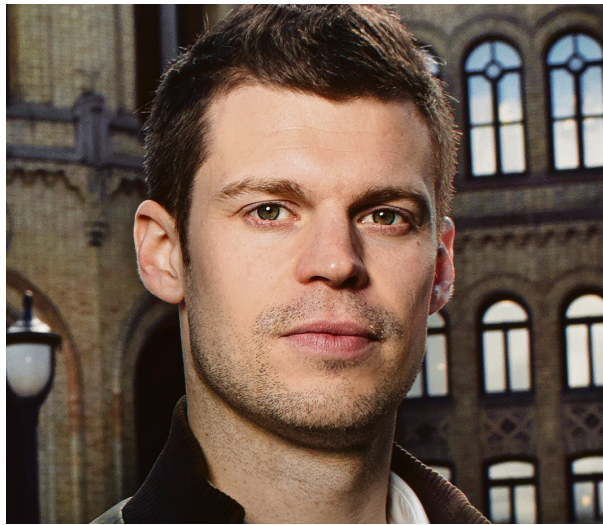
Rødt-leder: Bjørnar Moxnes.

– Vi krever at rapporten framover følges opp med full behandling med redegjørelse i Stortinget,