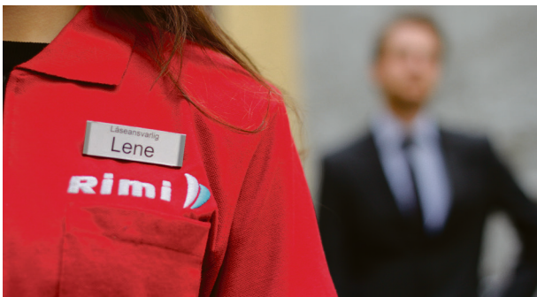
Arbeidslivet: Partiene på venstresida vil undersøke maktbalansen.