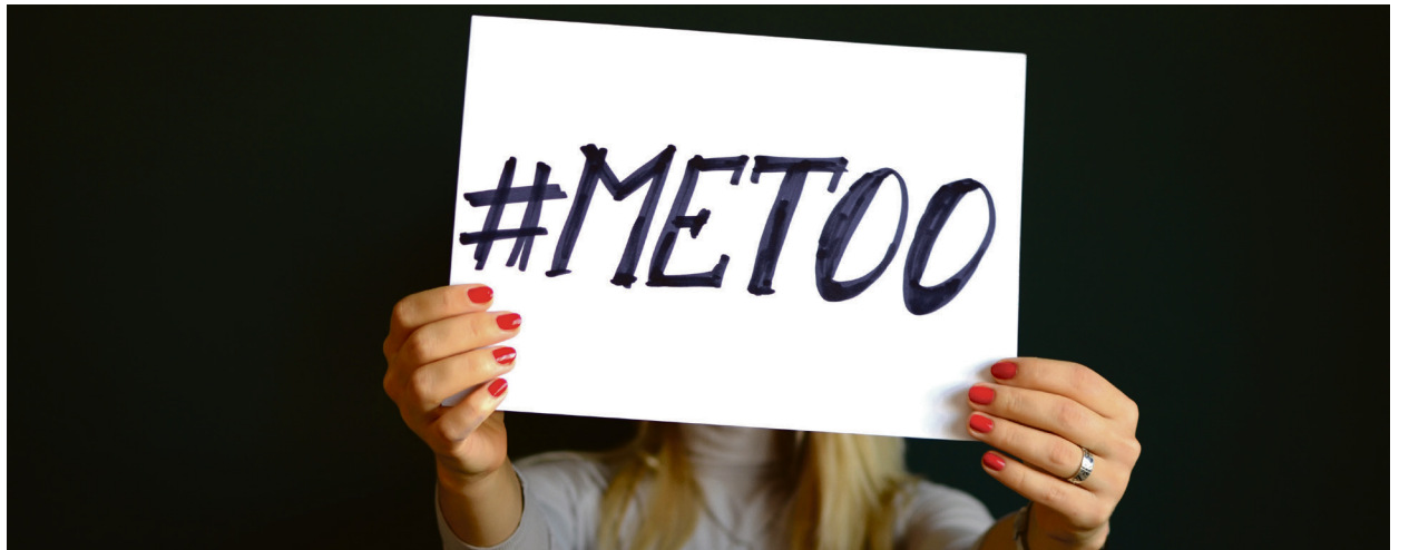
#metoo: Regjeringa vil ikke bruke penger på bekjempelse av seksuell trakassering.