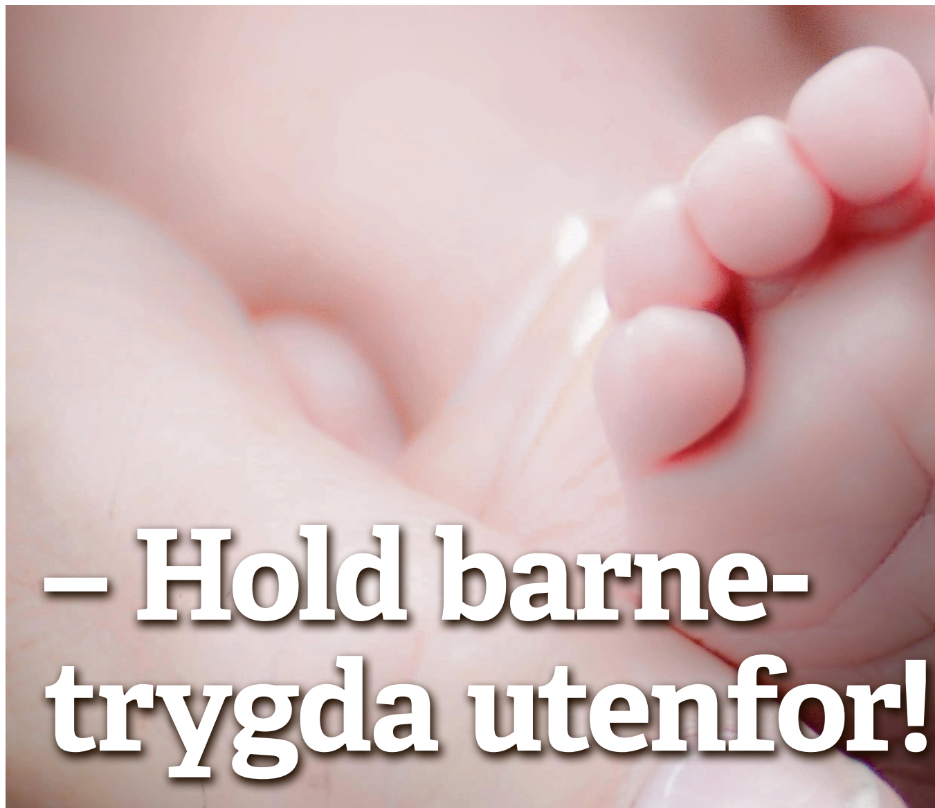
Når hver krone teller: Rødt vil holde barnetrygda utenfor når Nav beregner sosialhjelp.

Utgiver: Rødt Dronningengs gate 22 0154 Oslo